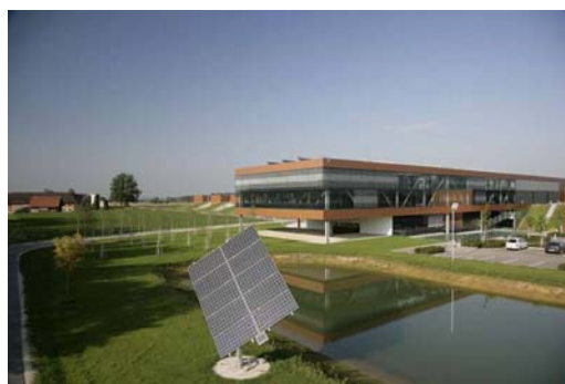
Standort Sattledt (Oberösterreich) mit 615 kWp PV-Anlage

Batterieladesysteme – Schweißtechnik – Solarelektronik